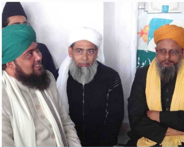
رسم اجرائی محفل میں