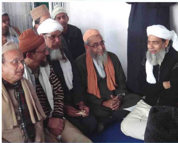
رسم اجرائی محفل میں