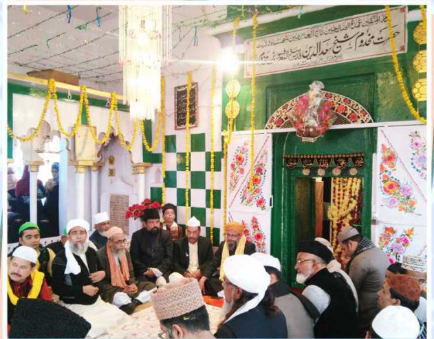
حضرت مخدوم شیخ سعد الدین خیر آبادی کی بارگاہ میں