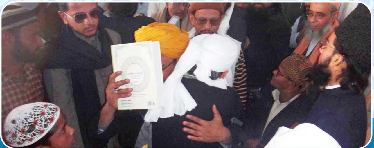
سجادہ نشین خانقاہ خیر آباد حضرت شعیب میاں مجمع السلوک کی اشاعت پر رب کا شکر ادا کرتے ہوئے