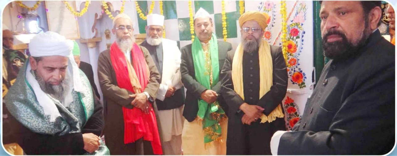
مخمل سماع کا ایک حسین منظر